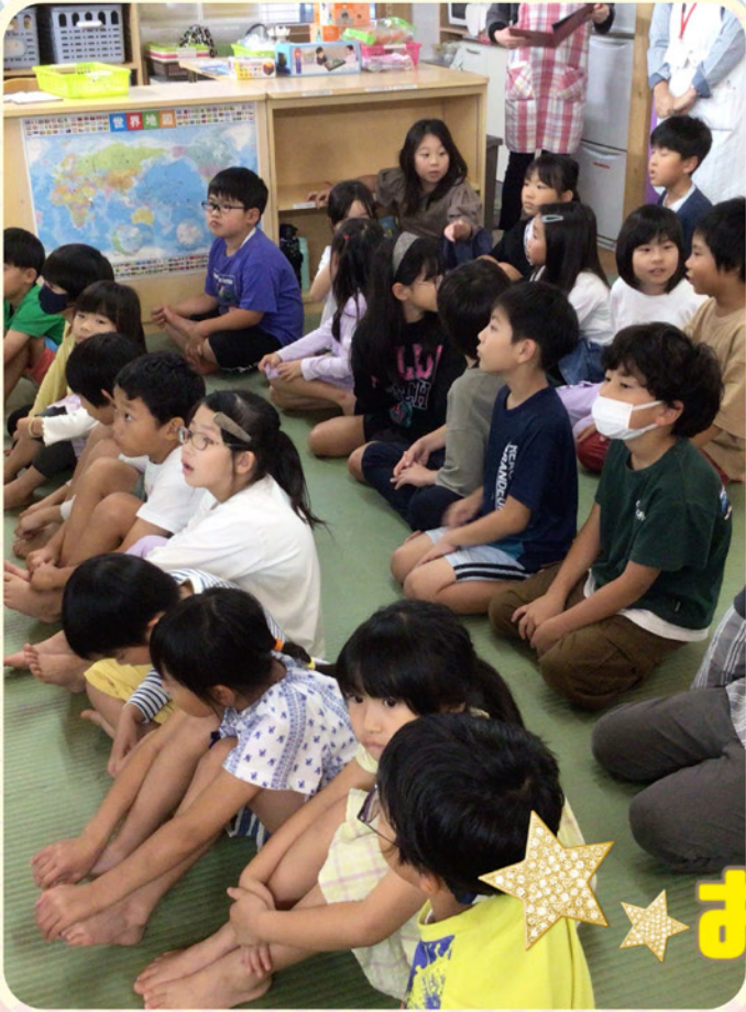
★ お金のきょうしつ